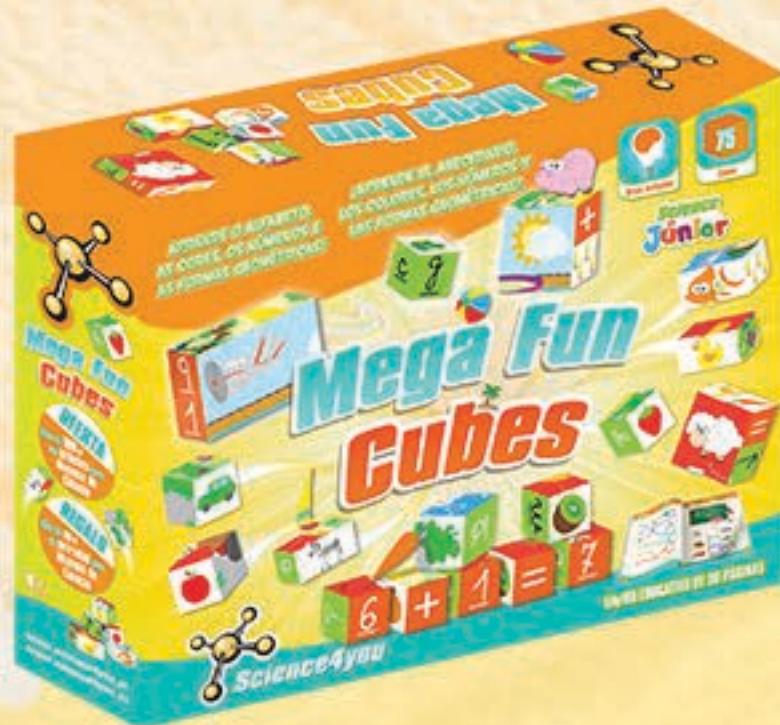
Mega Fun Cubes