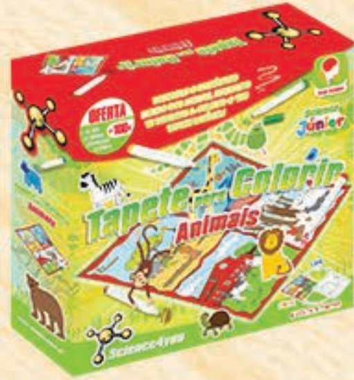
Tapete para Colorir Animais